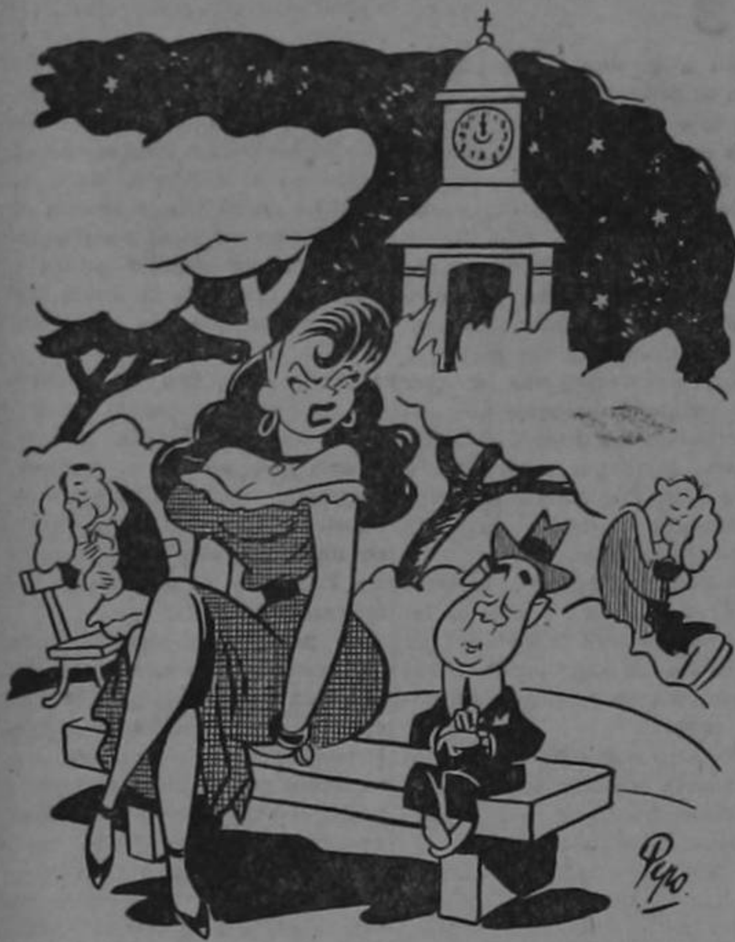
—¡Las doce!... Voy a darle cuerda a mi reloj...!